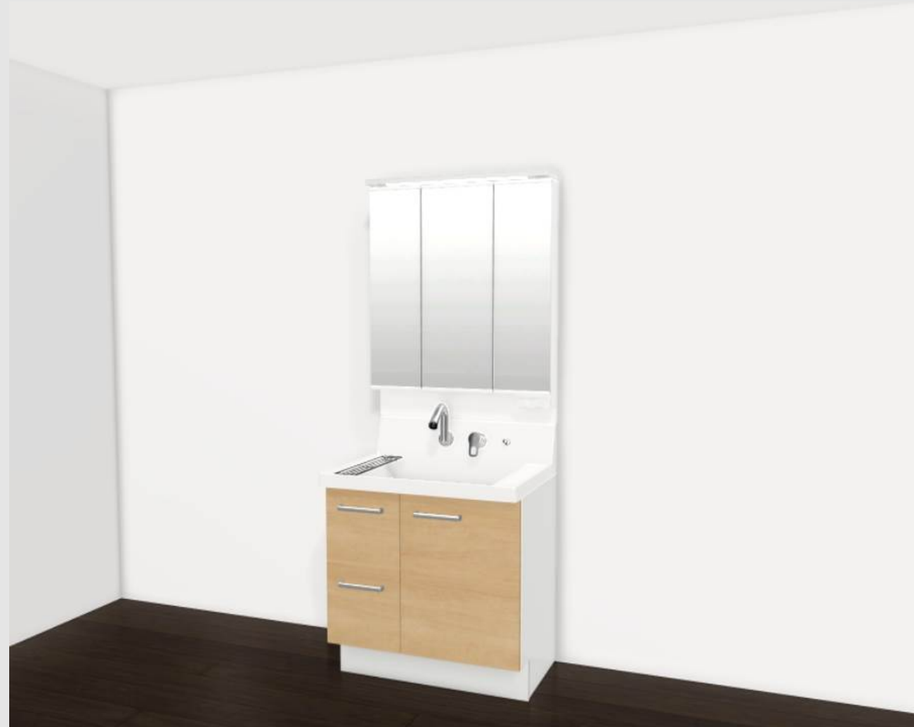
CG合成によるイメージ画像です。